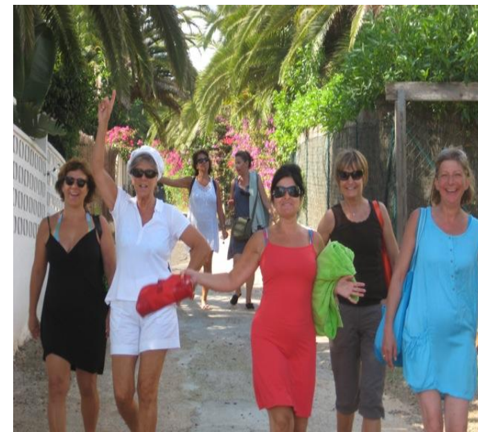
Vamos a la playa! Olé!