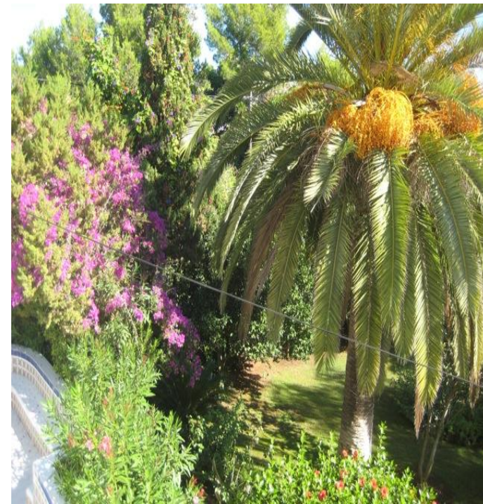
Unser Traumgarten, wie "Garten Eden" :-)