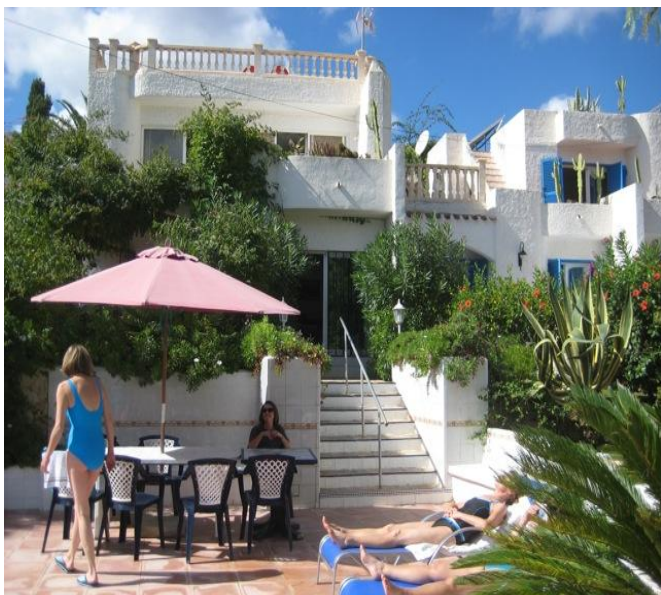
Sommerlich! Und das jeden Tag aufs Neue!