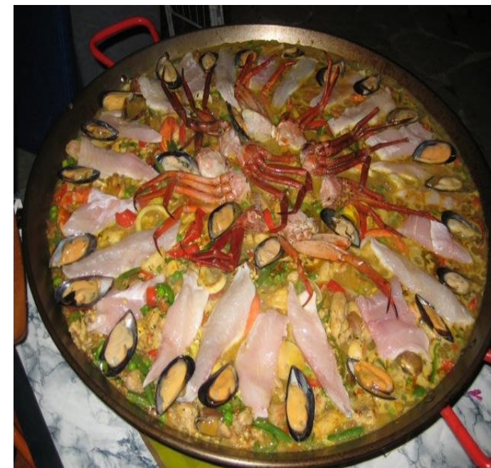
Ein Pracht, das Ganze und dann effektiv auch entsprechend fein!